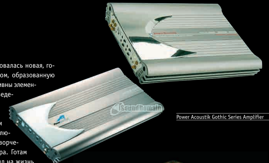
Power Acoustik Gothic Series Amplifier

Однажды готический храм потерял былую романскую четкость и замкнутость, перестал быть комбинацией ясных геометрических объемов — благодаря пластическому членению ярусов, глубине перспективы в порталах и нишах (там всегда прячется тень), благодаря огромным окнам, сложной композиции башен. Он приобрел вид живого, органического, растущего вверх сооружения, погруженного в стихию воздуха и света. Угадав трепетную игру света и тени, сообщавшую ритм и динамику готическим сооружениям, нынешний декор в готическом стиле противопоставляет себя простым и лаконичным объемам. При всем внешнем единстве частей у него живой, текучий характер. Готический дизайн отвергает равновесие и устойчивую взаимосвязь частей объекта, но де-